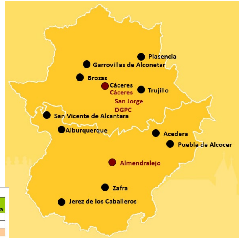
RESULTADOS FINALES DE LAS ACCIONES C1 Y C2